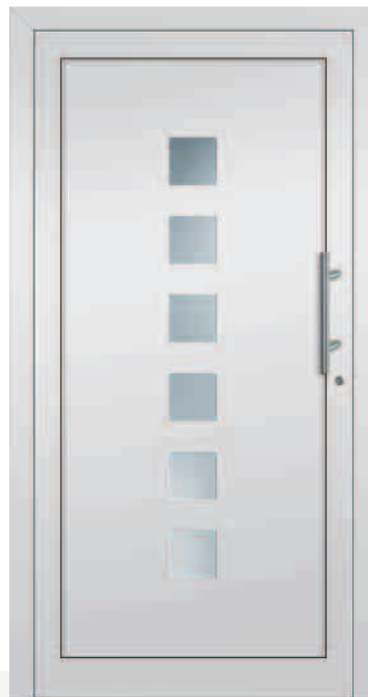
AM26/E Glas Mastercarré