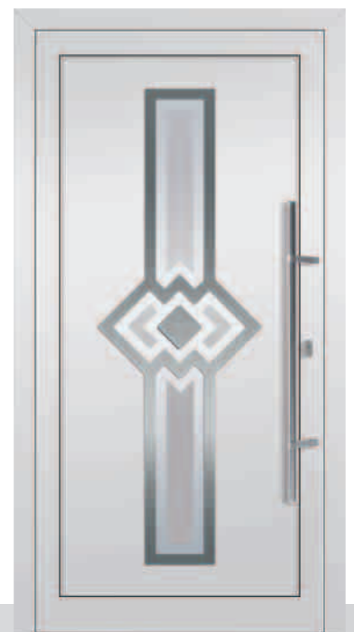
146-3/E Sandstrahlglas Y 670 Edelstahlrahmen beidseitig