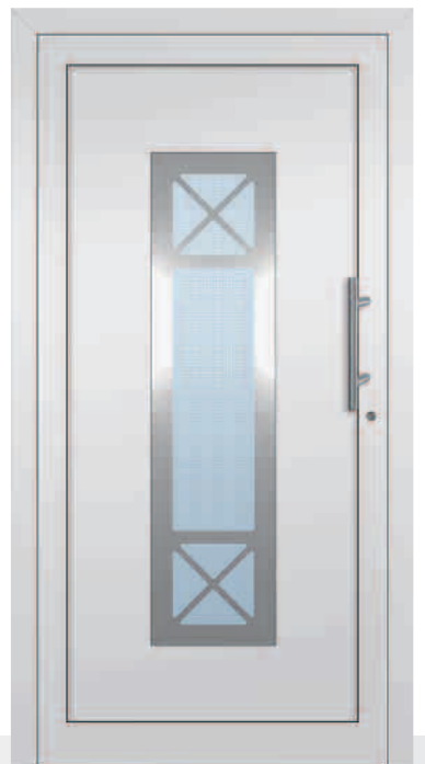
AM18/E Glas Mastercarré