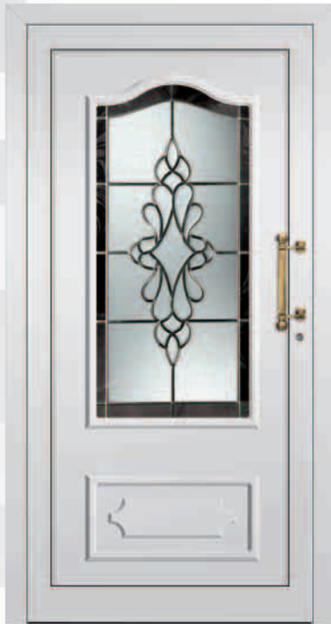
511/R Bleimotiv Y 614 Ornamentrahmen beidseitig Kassette außen