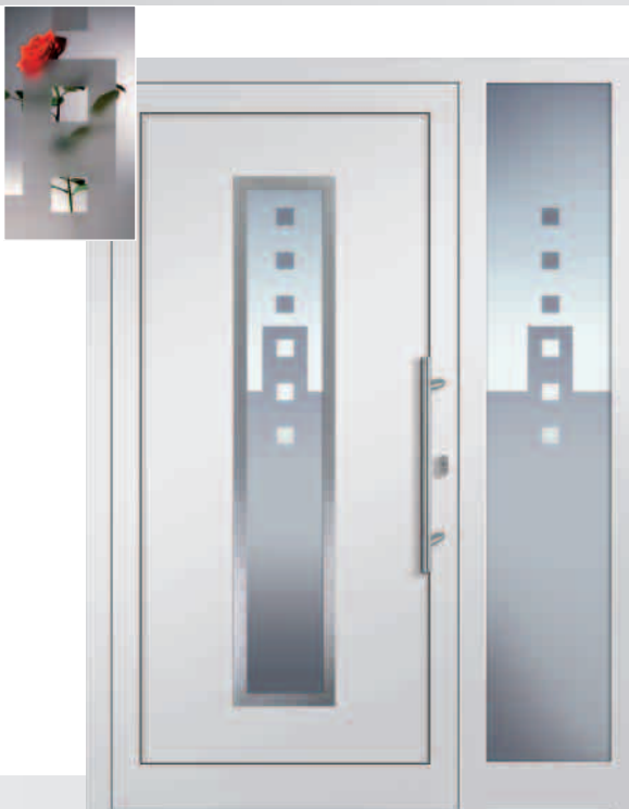
43-3/E mit Seitenteil ST 512 Sandstrahlglas Y 512 Edelstahlrahmen beidseitig