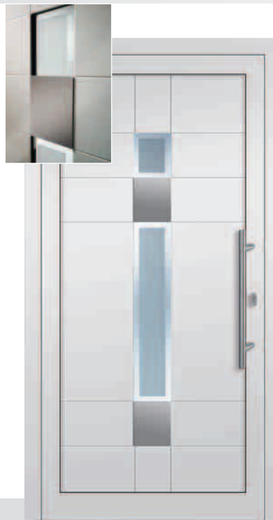
027-1/E Sandstrahlglas Y 561 Edelstahlapplikationen u. Ziernuten außen