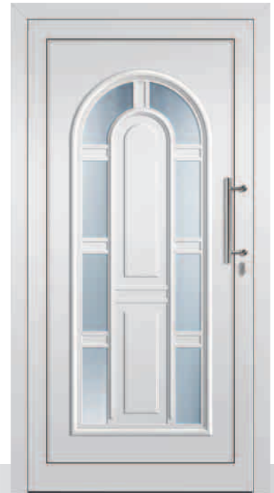
AM22/R Glas Chinchilla weiß