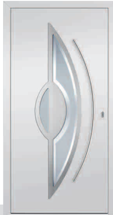
118-3/E Sandstrahlglas Y 597 Edelstahlrahmen beidseitig