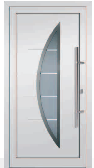
113-3/E Sandstrahlglas Y 593 Edelstahlrahmen beidseitig Ziernuten außen