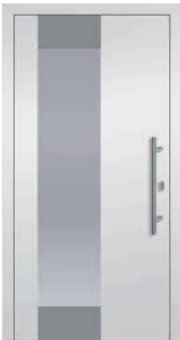
138-1/E Sandstrahlglas Applikationen ähnl. RAL 7037