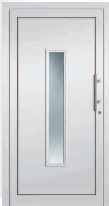
AM24/R Glas Mastercarré