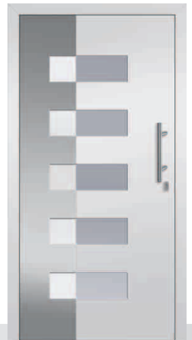
135-1/E Sandstrahlglas Y 665 Applikation Edelstahloptik außen