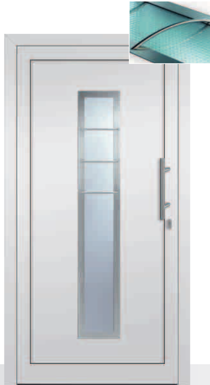
AM3/E Glas Mastercarré Edelstahlrahmen beidseitig Edelstahlstäbe außen