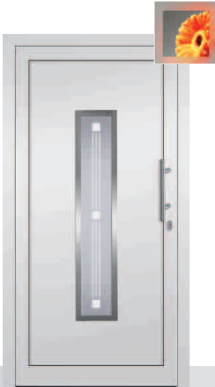
AM25/E Sandstrahlglas Y 650 Edelstahlrahmen beidseitig

Nicht nur das Aussehen überzeugt. Auch der Preis stimmt.