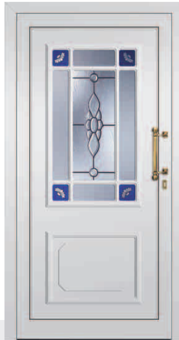
521/R Motivglas Y 820 Ornamentrahmen beidseitig