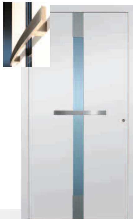
170-1/E Glas Parsol blau Edelstahlapplikationen außen